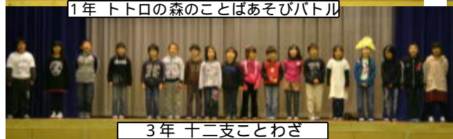
3年 十二支ことわざ