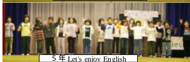
5年 Let's enjoy English