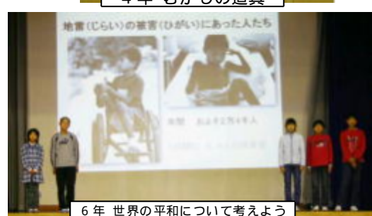
6年 世界の平和について考えよう