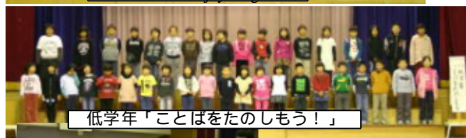
低学年「ことはをたのしもう！」