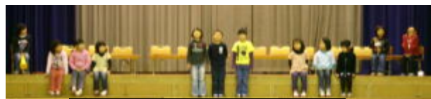
1年 トトロの森のことはあそびバトル

本部役員はじめPTA役員の皆様には、前日より準備等お世話になりました。また、当日のブルーシート敷きやうすの準備、餅つき、餅丸め、そして、最後の片付けまで、てきぱきと要領よく動いていただきました。お陰様で、大変スムーズに行事を運ぶことができました。本当にありがとうございました。