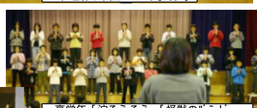
高学年「涙そうそう」「怪獣のパレード」