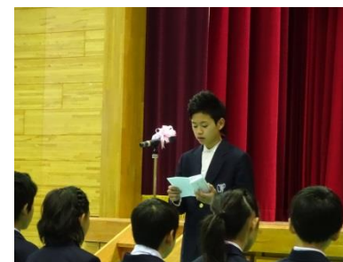
(生徒会長歓迎の言葉)