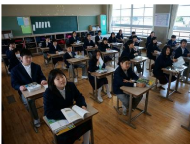
(新2年生初めての学活)