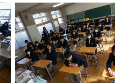
(新3年生初めての学活)