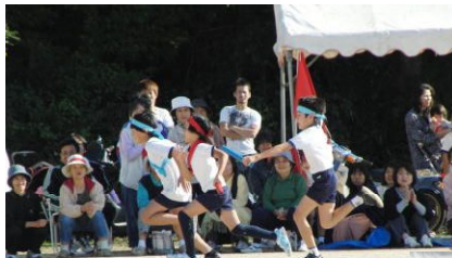
〈低学年親子障害走〉 おんぶはやっばりいいなあ。いい気持ち。↓

尚、運動会の途中でも竹野区連合区長様よりお知らせしていただきましたが、21日(水)の11時50分頃、航空写真撮影を行う予定をしています。できるだけたくさん保護者、地域の皆様方にも参加していただきたく思います。お忙しいこととは存じますが、参加していただける皆様は、準備もありますので、 11時15分までに学校にお集まりください。 よろしくお願いたします。