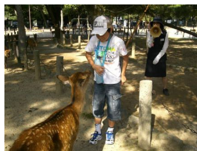
奈良公園では、鹿にえさを