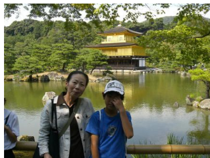
金閣寺をバックに

新型インフルエンザの流行で9月に延期されていた修学旅行。16日（水）、17日（木）の2日間、6年生は元気に京都・奈良方面へ行ってきました。間人小学校の児童と合同で、京都市内の目的地を班別行動で回るなどの体験もしてきました。観光客が多く道路が混みバスの到着が遅れてしまい、清水寺見学のため三年坂を駆け上がるということもありましたが、2日間ともよい天気恵まれ予定通りに楽しい旅行をすることができました。