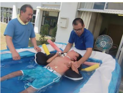
※写真はすべて学習日の様子です。

長い夏休みも終わってみればあっという間でした。学習日にはみんな元気な顔を見せてくれました。