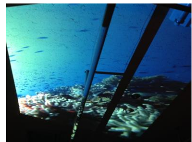
天井に映し出された海の世界

8月29日(月)に、児童生徒3人揃って、2学期の始業式を行いました。夏休みの宿題や2学期の目標を発表し合いました。さあ、始まりです。