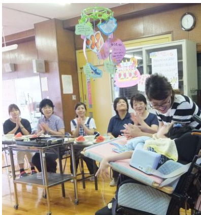
みんなからお誕生会のお祝い