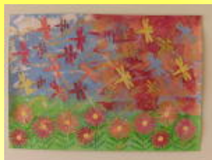
【左：児童の作品】 「とんぼのうんどうかい」

この度、児童2名の共同作品を京都丹波美術工芸教育展に出品したところ、奨励賞を受賞しました。また、10月21日(日)には、南丹市園部国際会館で行われていた京都丹波美術工芸教育展に、ご家族の方々と担任が参加・鑑賞して、受賞の喜びを分かち合いました。