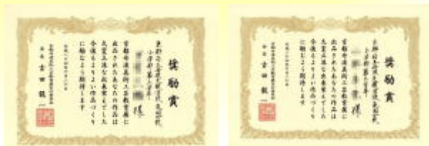
【下：2枚の賞状】 「奨励賞」