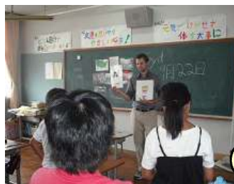
マリオ先生と6年生の授業

他の学年の子どもたちも、給食後の遊びで鬼ごっこやサッカーをしてすぐに親しくなりました。