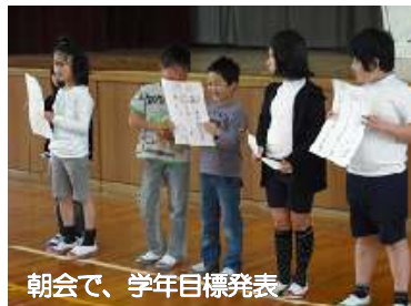
朝会で、学年目標発表

一生懸命に相手の話を聞くことで、信頼関係が築かれます。各学年、目標を決め毎日振り返りをしています。そして、よくなったことを、昇降口の廊下に張って、全校で確かめています。