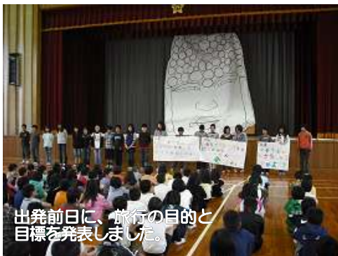
出発前日に、旅行の目的と目標を発表しました。

事前学習で、大仏の手と顔の製作に取り組みました。体育館ステージに登場した大仏の顔の大きさに全校が驚きました。また、大きさを理解しやすいように「大仏の鼻の穴の大きさは？」と、クイズ形式にして全校に分かりやすく説明しました。