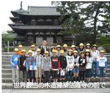
世界最古の木造建築法隆寺の前で

6年生が修学旅行中、丹波小学校を任せられたのは5年生でした。通学班での登下校、委員会活動、掃除など6年生の欠ける役割を分担して補い、全校を引っ張って、立派に留守番をしました。5年生もたくましくなった2日間でした。