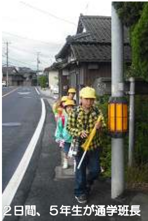
2日間、5年生が通学班長