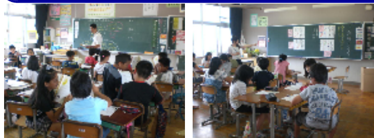
4年「あなたならなんて答える」 6年道徳「こんなときどうする」

グループやペアでの相談を行ったり、役割演技をしたりしながら、相手の立場にたって考え、行動することの大切さや自分の思いをきちんと相手に伝えることの大切さを学習しています。