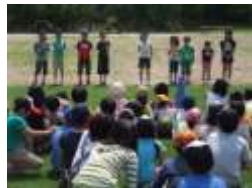
全校レクリエーション