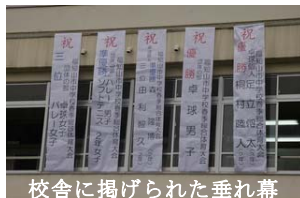
校舎に掲げられた垂れ幕