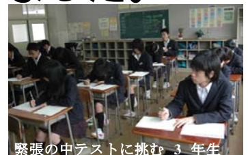
緊張の中テストに挑む3年生

20日(火)、3年生が全国学力・学習状況調査を受けました。この調査は、昨年度まで「全国学テ」と呼ばれ全国すべての小6、中3生が受験していた調査です。今年度は、学校ごとに抽出され、成和中学校はその対象として選ばれました。3年生は、緊張の中、一生懸命に取り組んでいました。結果については、2学期になると思いますが、個人のデータが送られてきますので個別にお返ししたいと思います。