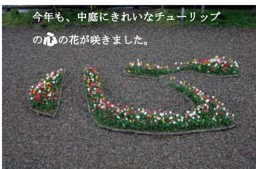
今年も、中庭にきれいなチューリップの心の花が咲きました。

それぞれ経験年数は違いますが、今日より明日、明日より明後日と常に前進していける教師でありたいと思っています。みなさまの忌憚のないご意見をお寄せください。