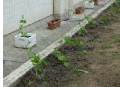
少し成長したゴーヤカーテン