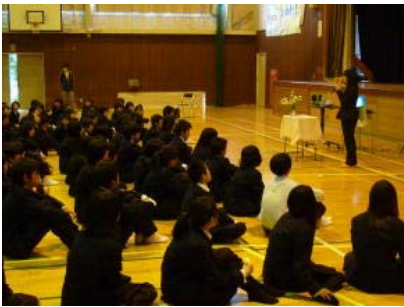
非行防止教室～携帯電話の使い方～

福知山警察の講師にお世話になり「ネットいじめ」「学校裏サイト」「個人情報流失」「生活習慣の乱れ」「学力問題」などについて学習しました。1・2年生が真剣に学習することができました。