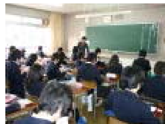
5/1 授業参観お世話になりました。