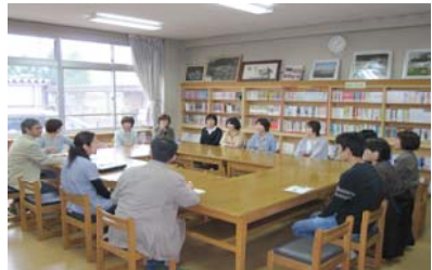
2会場に分かれて活発な話し合いがおこなわれました。

先月23日（日）授業参観の後に「親のための応援塾」を開催しました。今年生の保護者を対象に「中学校ってどんなところ？」という素朴な疑問を、中学生を持つ親の先輩であるPTA本部役員の方が保護者の立場からその疑問に答えるというものでした。当日は1年