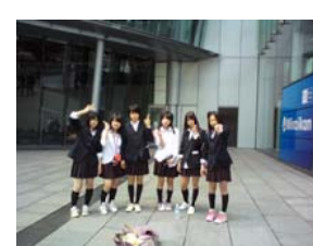
未来科学館前にて

や「価値観」は、必ず次の世代に伝えていかなければなりません。そのために、「古い言葉」を大切に、機会があるごとに子どもたちに教えて