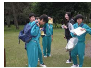
ウォークラリーを兼ねたボランティア清掃活動

うことを改めて実感しました。私たちにできる身近なことを今日からたくさんしていきたいです。