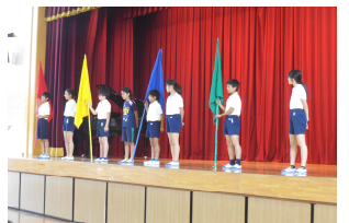
団長・副団長決意の言葉

今年度の運動会のスローガンのように、これまで重ねてきた全校のみんなの努力を集めることができれば、きっと一人一人の心に残るすばらしい精華台小学校の運動会になることでしょう。教職員も一人一人が輝ける運動会になるよう指導に当たっていきたいと思います。当日は、子どもたちの頑張りに大きな声援をよろしくお願いいたします。