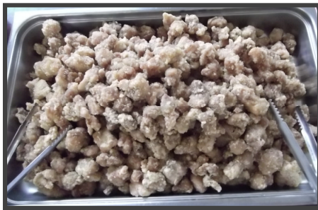
とり肉のから揚げ