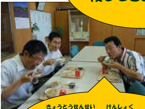
きょうとうせんせい けんしょく 教頭先生が検食して くださいました。