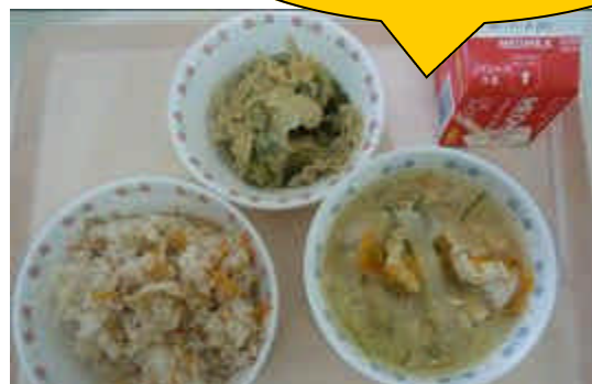
ちやめし ゆば ひた しる ぎゅうにゅう 茶飯・湯葉とオクラのお浸し・みそ汁・牛乳