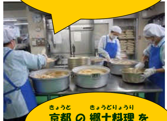
きょうと きょうとりょうり 京都の郷土料理を いただきました。