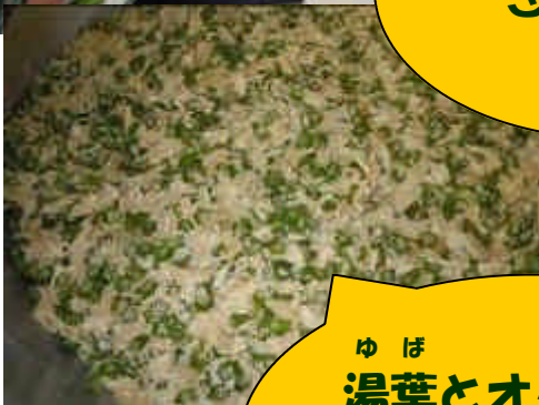
ゆば 湯葉とオクラのお ひた 浸しできあがり！