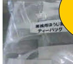
ちゃ ほうじ茶を にだ 煮出しました。