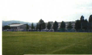
芝生化されたグラウンド