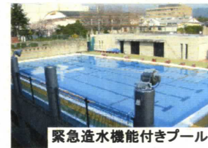
緊急造水機能付きプール

乙訓で 鍛える 知力・体力・人間力 乙訓で 創る 君自身の物語(ストーリー) (乙訓高校スローガン)