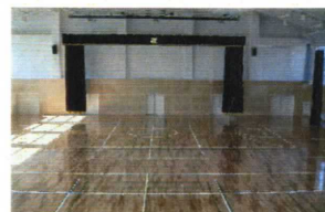
新設された大きな体育館