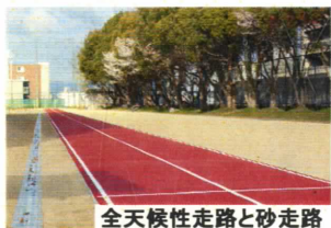
全天候性走路と砂走路