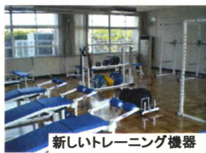
新しいトレーニング機器