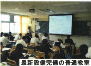
最新設備完備の普通教室