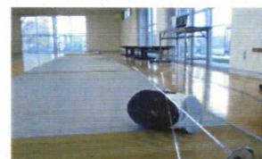
府立高校初のフェンシング場