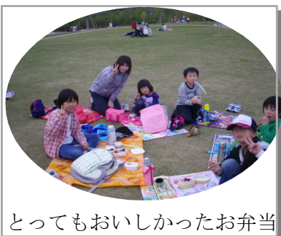
とってもおいしかったお弁当