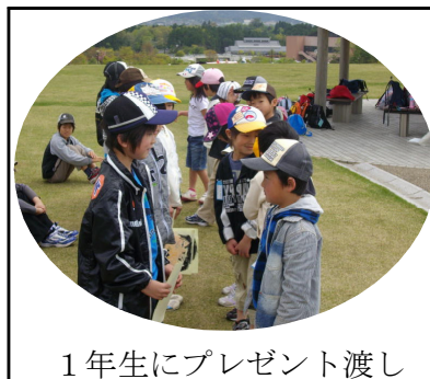
1年生にプレゼント渡し