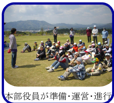
本部役員が準備・運営・進行

先日、全校遠足を福知山・三段池公園で、実施しました。当日はすばらしい天気恵まれ、1年生歓迎会・全校遊び・班別ゲームなどを楽しみました。遊びの計画や当日までの準備は児童会本部や6年生が中心となり、高学年としてリーダーシップを発揮し、楽しい活動ができました。歓迎会では、1年生が絵を見せながら自己紹介をし、各学年から手づくりプレゼントが贈られました。みんなも笑顔で、有意義な遠足になりました。