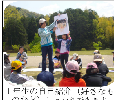
1年生の自己紹介(好きなものなど)しっかりできたよ