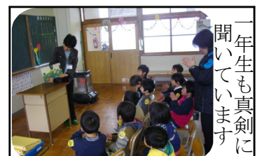
一年生も真剣に聞いています