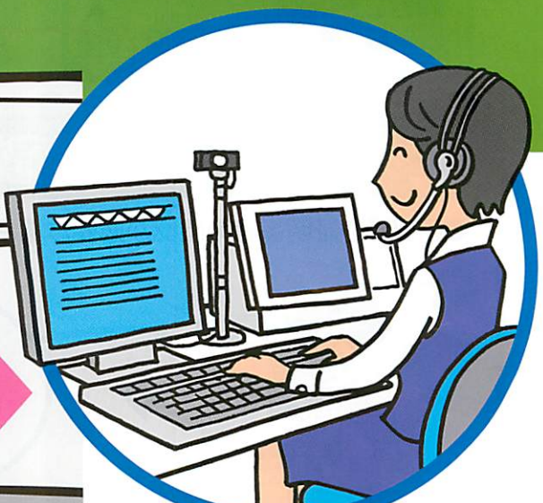
「みどりの券売機プラス」 コールセンター