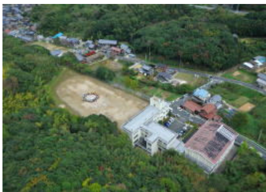
【校章(一部)の人文字と校舎】