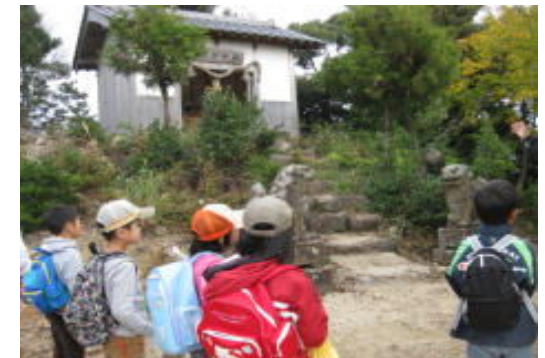
【山頂にある徳楽神社】