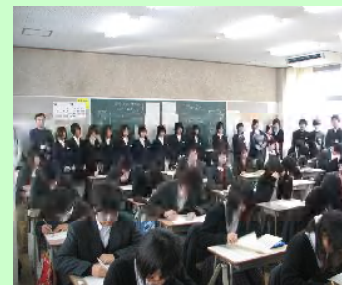
(昨年度の授業見学の様子)