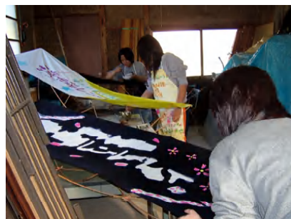
企業現場での実習

「ものづくり」と「地域産業の人材育成」充実 企業技能者による専門の講義や地元企業での実習