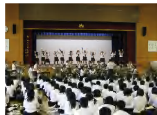
(吹奏楽部の歓迎演奏)