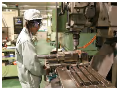
インターンシップ体験