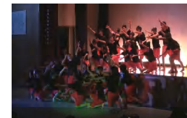
(文化の部 ステージ)