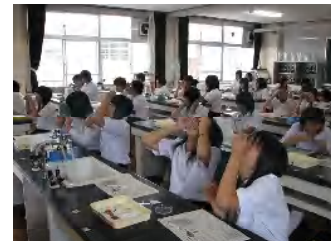
(簡易顕微鏡の作成)