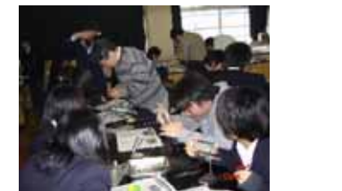
SPP(サイエンス パートナースHIP プログラム)