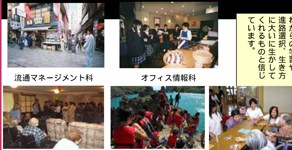
流通マネジメント科

本校の特色行事の一つである研修旅行を上の日程で行いました。学科・コース別にテーマを設定して、「体験」を取り入れた研修旅行を実施しています。参加した生徒たちは、貴重な体験を通して多くのことを学び帰ってきました。今回の旅行で得たことを、これからの学習や、進路選択、生き方に大いに生かしてくれるものと信じています。