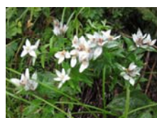
ハヤチネウスユキソウ

今回の山行計画は4日間で4山に登ることに決めていた。月山、鳥海山、早池峰山、岩手山である。月山は高山植物の宝庫である。