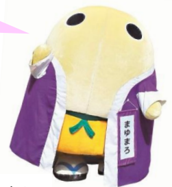
京都府広報監 まゆまろ