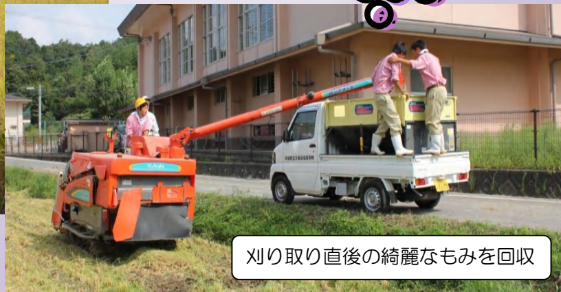
刈り取り直後の綺麗なもみを回収