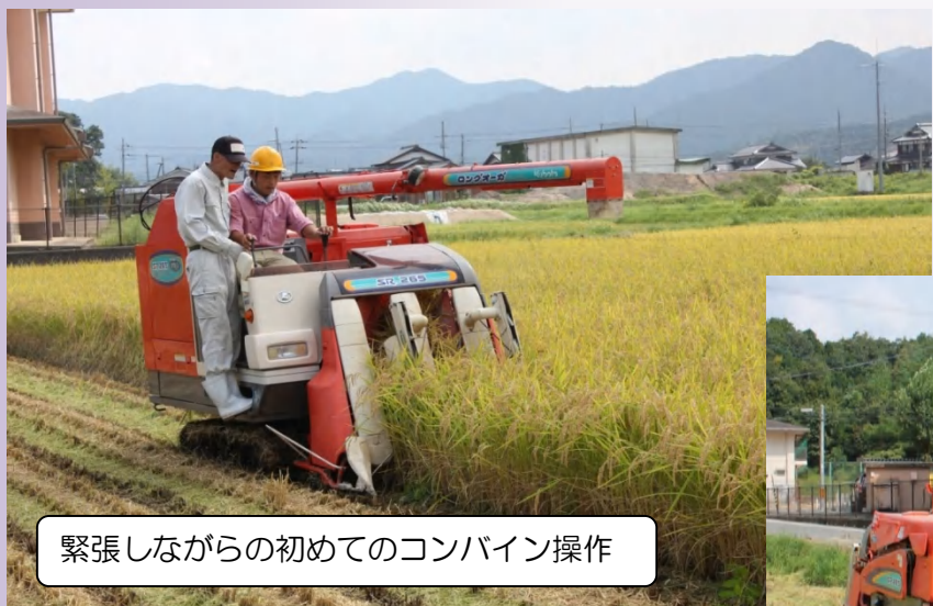
緊張しながらの初めてのコンバイン操作

ほかにも、生徒達が土づくりから田植え、除草、水管理など多くの作業を行って大切に育てた水稻（コシヒカリ）が収穫の時期を迎え、たわわに実った稲を、教員の指導を受けながらコンバインを使って刈り取りました。