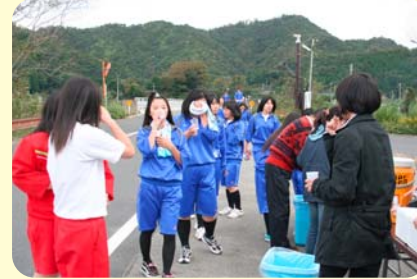
↑給水所で水分補給

10月29日(金)校内持久走大会を行いました。生徒はこの日に向けて体育の授業などで練習を積んできており、それぞれの目標を胸に、男子は17.1 km、女子は14.7 kmの道のりを力走しました。沿道の方々からの御声援や、PTAの給水活動などの御支援もあり、今年は参加者全員が制限時間内に完走することができました。