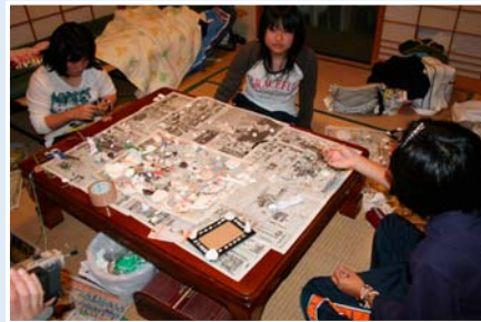
貝殻を使ってアクセサリー製作(伊江島 民家泊)