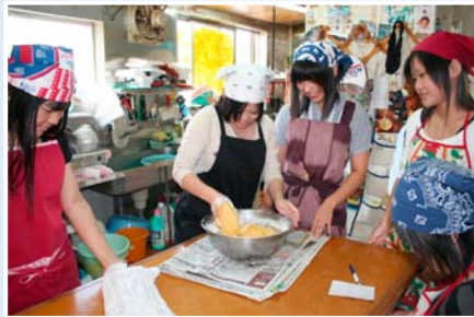
琉球料理やお菓子作りに挑戦(伊江島 民家泊)