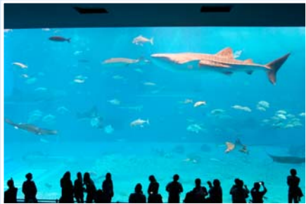
飼育期間記録を更新中のジンベエザメやマンタなどに見入る生徒(美ら海水族館)