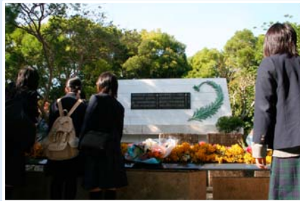
ひめゆりの塔にて千羽鶴と花を供え参拝