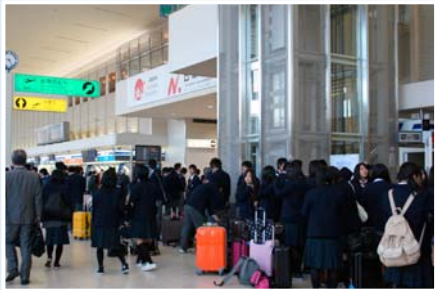
緊張と興奮の出発前(伊丹空港)