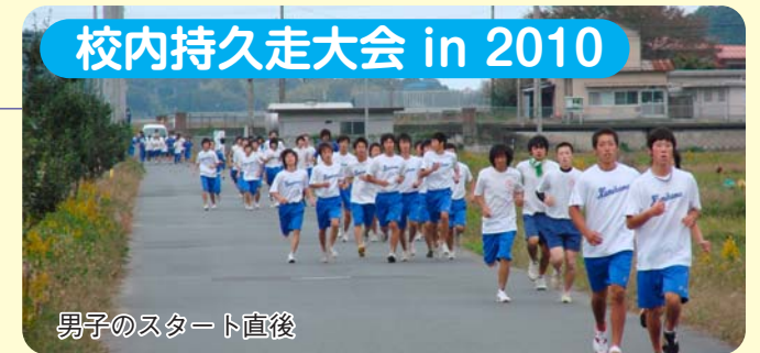
男子のスタート直後