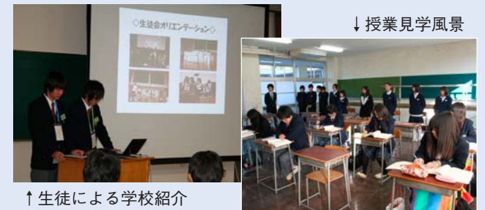
↑生徒による学校紹介

11月20日(土)中学生及びその保護者を対象に学校公開を行いました。丹後通学圏の各中学校からたくさんの中学生や保護者の皆さんが来校し、全体会で本校の説明を聞いた後、班ごとに分かれて4つの系列を見学してもらいました。