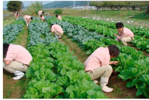
秋の収穫に向けて（生産科学系列）