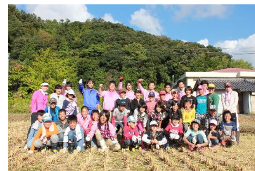
稲刈りを終えた田んぼで記念撮影