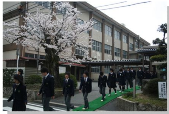
樹齢100年以上のそめいよしのをくぐる新入生

桜が満開を迎える中、平成23年度入学式を本校体育館にて行いました。今年度の新入生84名を迎え、新入生呼名、校長式辞、御来賓からの祝辞などに続き、在校生を代表して生徒会長が「歓迎のことば」を述べ、新入生を温かく迎えました。