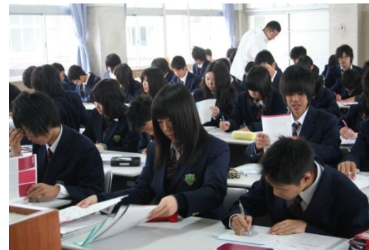
第一弾 第一学年対象 基礎学力向上「学び直し」風景

本校は、「学びの再構築」をテーマに、15人以下の習熟度別の少人数講座で、基礎的な学力や社会的教養を備えた地域を支える人材の育成を目指します。