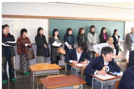
昨年度の授業参観ツアーの様子