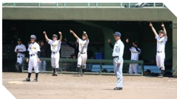
対加悦谷高校 逆転しベンチを飛び出す選手

本校野球部は初戦で加悦谷高校と対戦し、選手とスタンドの応援団が一体となり、接戦の末見事勝利しました。三回戦は西舞鶴高校と対戦しましたが、惜しくも敗れました。