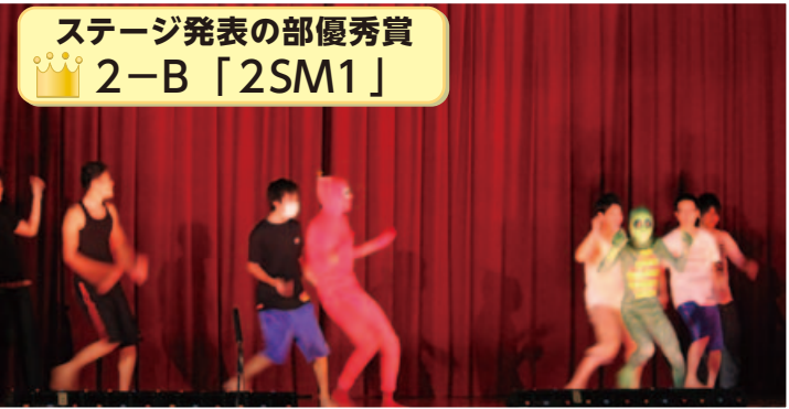
ステージ発表の部優秀賞 👑 2-B 「2SM1」