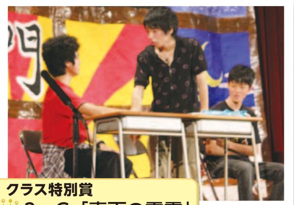
クラス特別賞 👑 3-C 「青天の霹靂」