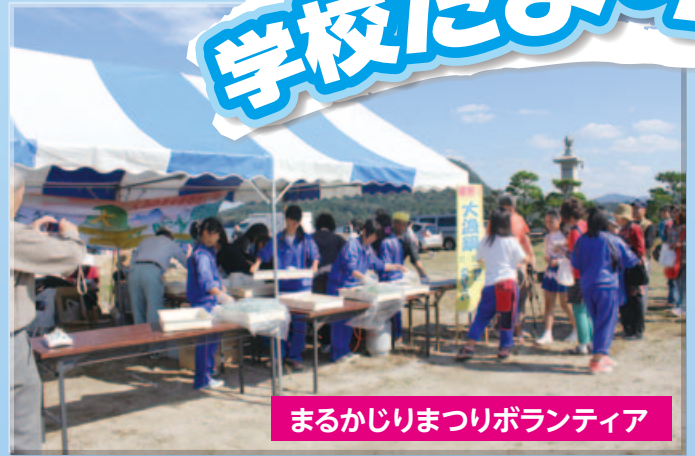
まるかじりまつりボランティア