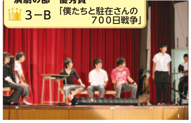
演劇の部 優秀賞 👑 3-B 「僕たちと駐在さんの700日戦争」

9月3日、4日に文化祭が実施されました。最高の夏の思い出～ the summer memory～というテーマの下、生徒会執行部、クラスリーダーを中心として準備に取り組みました。取組の成果を発揮し最高の夏の思い出となったと思います。