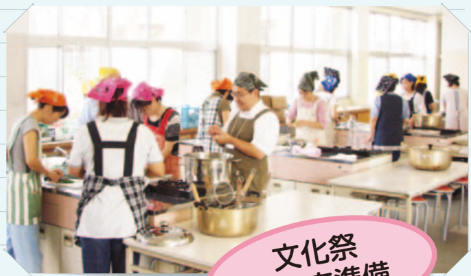
文化祭 模擬店準備