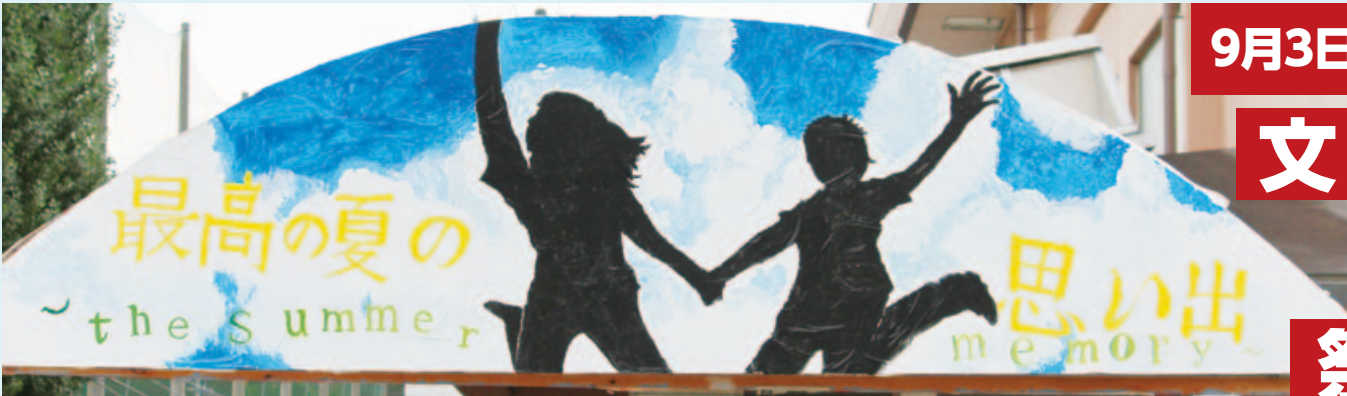
演劇の部 最優秀賞 👑 1-C 「スクールおばけ」