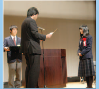
京都府丹後広域振興局長賞 受賞