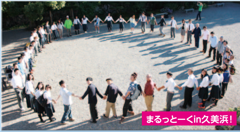
まるっとくin久美浜!