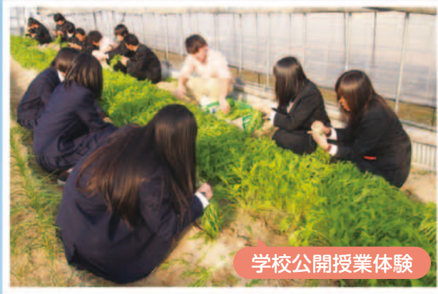
学校公開授業体験