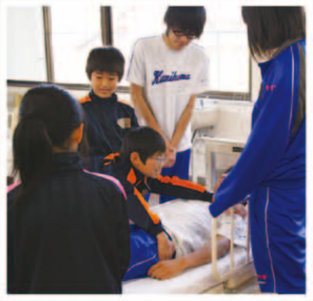
佐濃小学校福祉体験学習