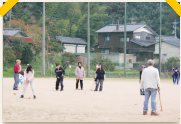
親睦球技大会 (グラウンドゴルフ)