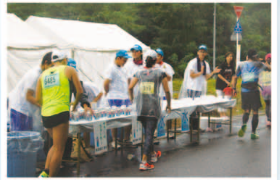
100kmウルトラマラソンボランティア