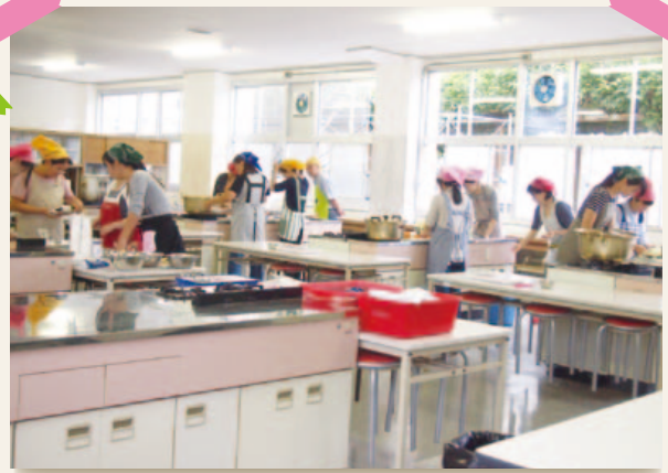
文化祭模擬店 「ママス&パパス」