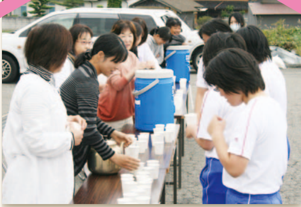
持久走給水活動・応援