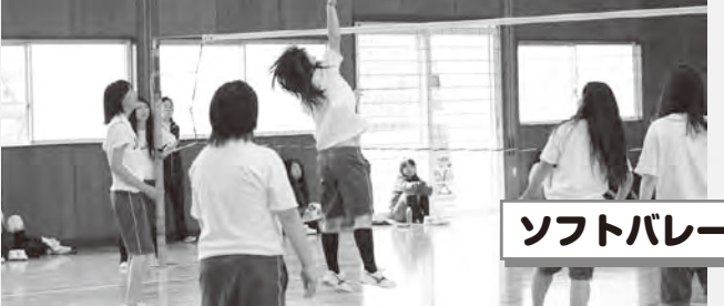
ソフトバレーボール (女子)