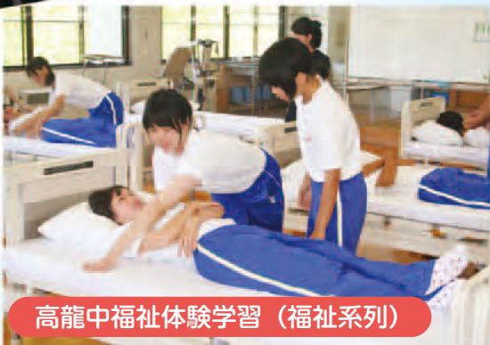
高龍中福祉体験学習（福祉系列）