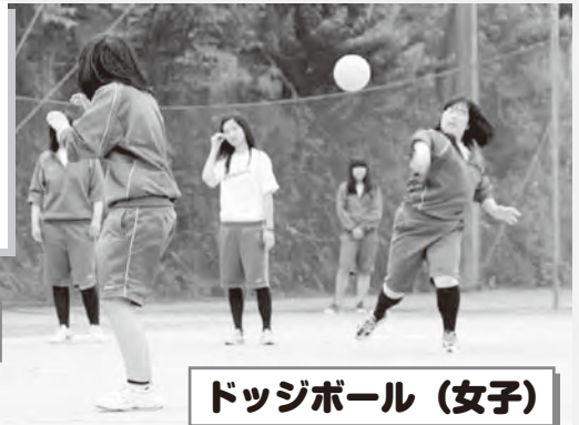
ドッジボール (女子)

6月1日(金)校内球技大会が開催されました。全部で4競技を行い、生徒は全力でプレーし、応援にも熱が入りとても盛りあがっていました。