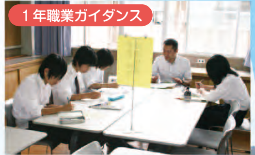
1年職業ガイダンス