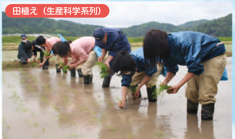
田植え（生産科学系列）