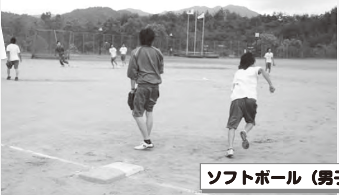
ソフトボール (男子)