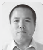
大同 教照 (国語)