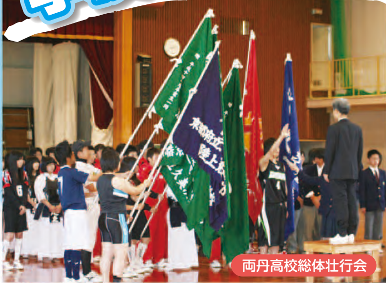
両丹高校総体壮行会