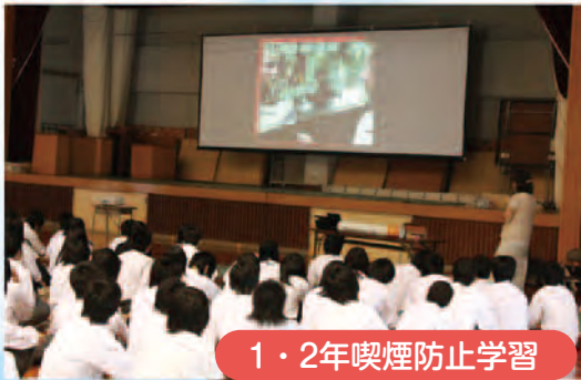
1・2年喫煙防止学習