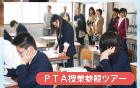
P T A 授業参観ツアー