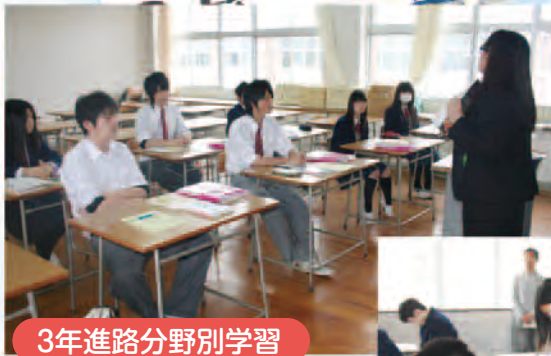
3年進路分野別学習