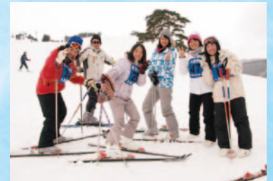
スキー・スノーボード実習