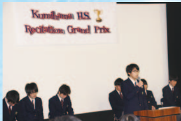
レシテーショングランプリ