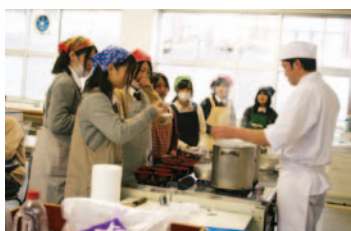
社会人との 交流会