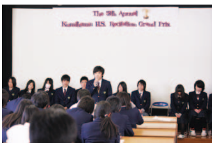
レシテーショングランプリ