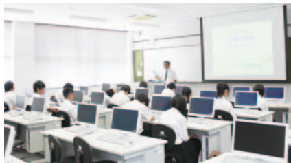
中学生体験セミナー