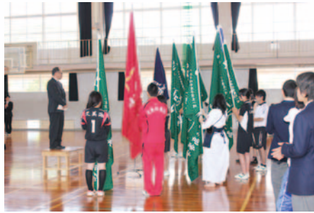
両丹高校総体壮行会