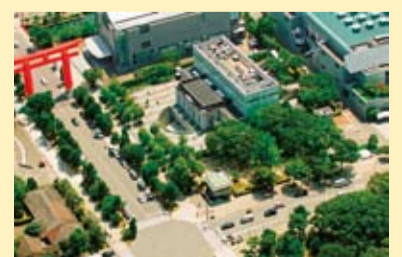
現在の府立図書館