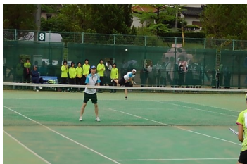
ソフトテニス両丹総体