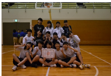
女子バスケットボール両丹総体第3位