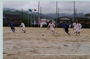
サッカー 加悦高VS宮津高

5月19日(土)に両丹高等学校総合体育大会が行われました。本校はサッカー会場となり、小雨の中、本校、サッカー部の選手たちは本校生徒や保護者の方から「ナイスプレー!」「ナイスキーパー!」などの声援を受けながら精一杯のプレーを見せてくれました。躍動感ある高校生の姿には感動します。生徒たちは各競技とも最後まで全力を出し切りました。この大会をもって、3年生が多く引退します。引退後は進路実現に向けての学習の日々が続きます。引退まで続けてきた粘り強い生徒たちに大きなエールを送りたいと思います。