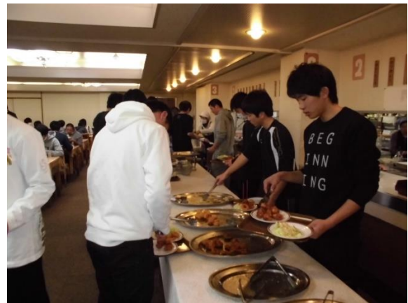
夕食バイキングの様子