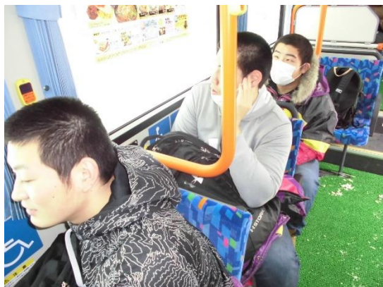
路線バスで移動中