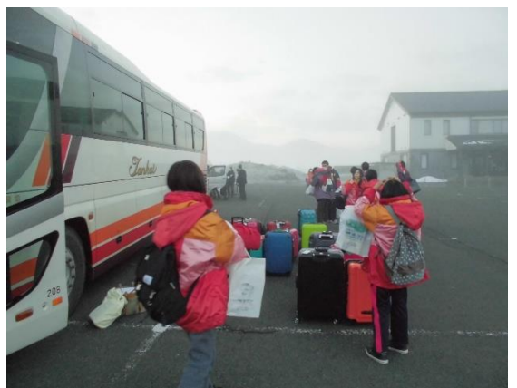
無事 わーくぱるに着きました