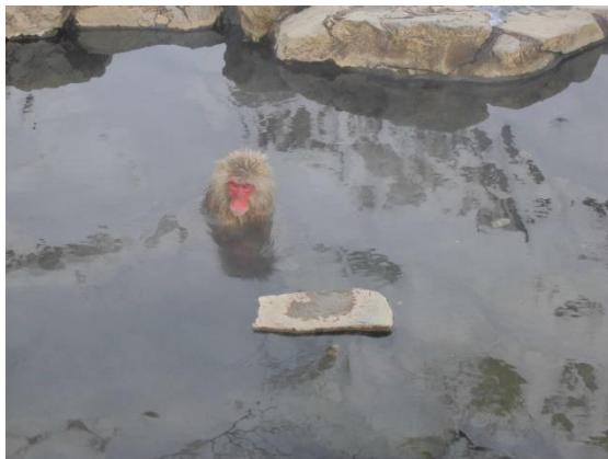
地獄谷野猿御苑にて