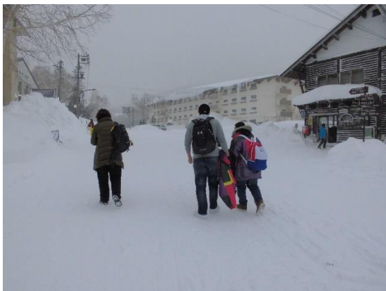
路線バスに向かう途中

スキー見学者は、湯田中温泉で体を癒し、地獄谷野猿御苑にて温泉に入る猿を見学しました。