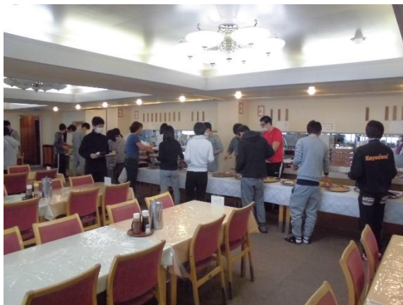
朝食バイキングの様子