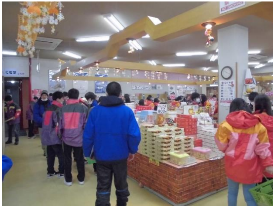
信州フルーツランドにて（お土産購入）