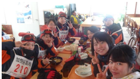
ツアースキー (昼食の様子)