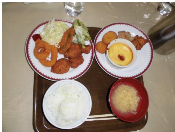
夕食バイキング（標準的な量）