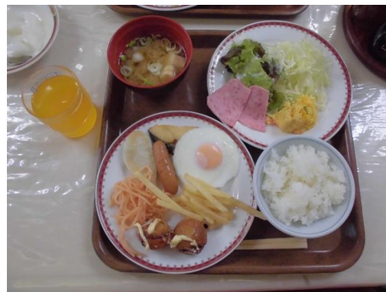
朝食バイキング (標準的な量)