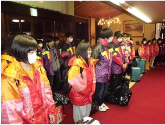
お世話になりました