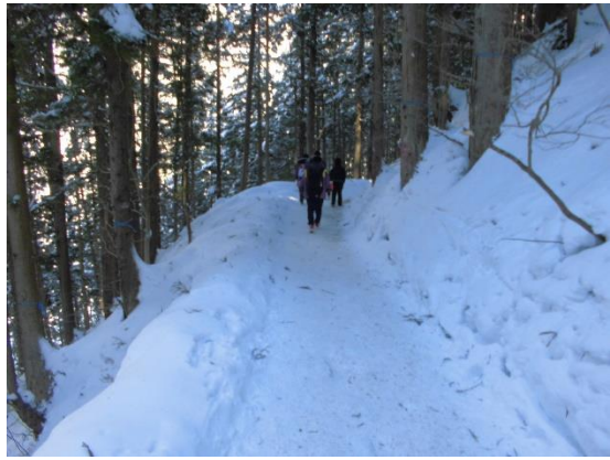
地獄谷野猿御苑に向かう途中（片道約2kmの雪道を歩きました）