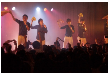
音楽鑑賞6/3(金) Permanent Fish ライブ

Web サイトもご覧ください http://www.kyoto-be.ne.jp/kayadani-hs/