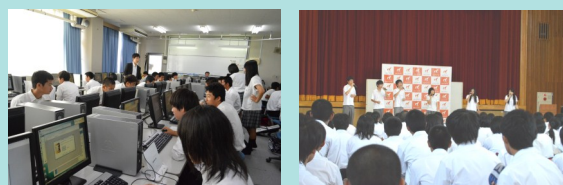
昨年の体験セミナーの様子