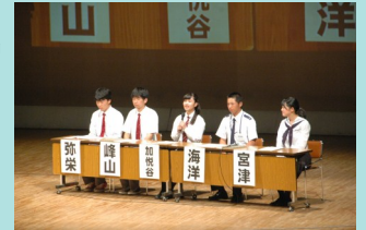
合同説明会の様子