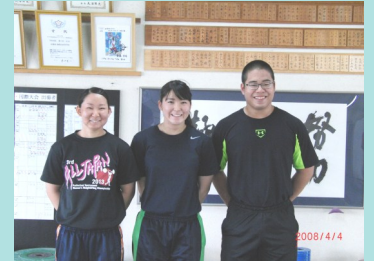
ウェイトリフティング部

5月末から6月中旬に行われた、全国高校総体京都府予選会・近畿地区予選会の結果、本校から3名が全国大会へ出場することとなりました。また、すでに全国総合文化祭出展が決まっている1名を含め、4名の生徒が全国大会での活躍を決意し、日々練習に励んでいます。今後とも御声援をよろしくお願い致します。