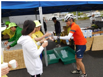
TANTANロングライドでの ボランティア活動 6/5(日)

Web サイトもご覧ください http://www.kyoto-be.ne.jp/kayadani-hs/