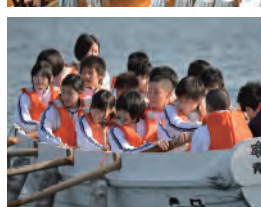
新入生オリエンテーション合宿