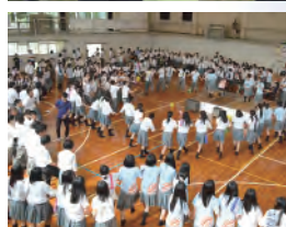
与謝の海支援学校との交流会