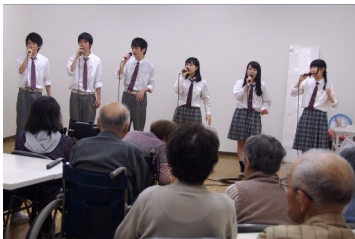
合唱部ミニライブ グループホームよさの 5/17

Web サイトもご覧ください http://www.kyoto-be.ne.jp/kayadani-hs/