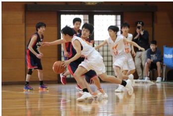
バスケットボール 春季大会 4/29

Web サイトもご覧ください http://www.kyoto-be.ne.jp/kayadani-hs/