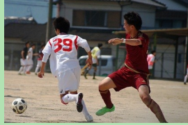
サッカー 加悦高VS宮津高