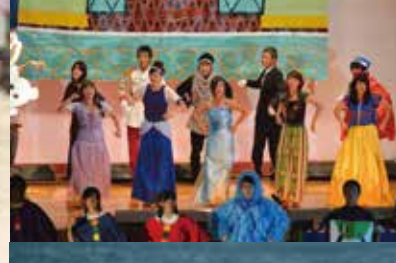
ソフトボール同好会