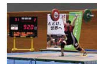
ウェイトリフティング部