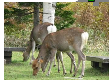
エゾシカもすぐ身近に登場。