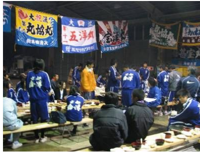
夕食は、バーベキューの醍醐味たっぷりです。