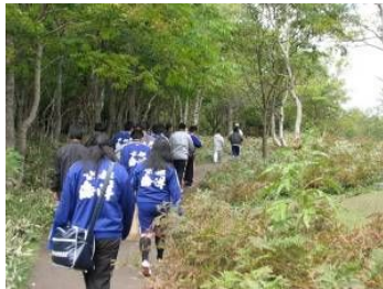
ネイチャーガイドの説明を聞きながらの知床世界自然遺産の散策