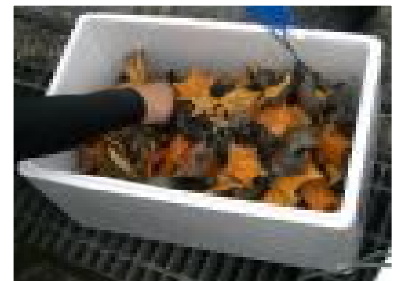
【ヒトデ駆除実習(京都府漁業士会交流実習)】