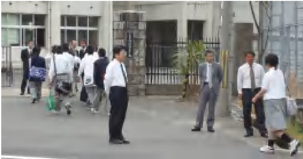
【毎朝の立ち番指導風景】