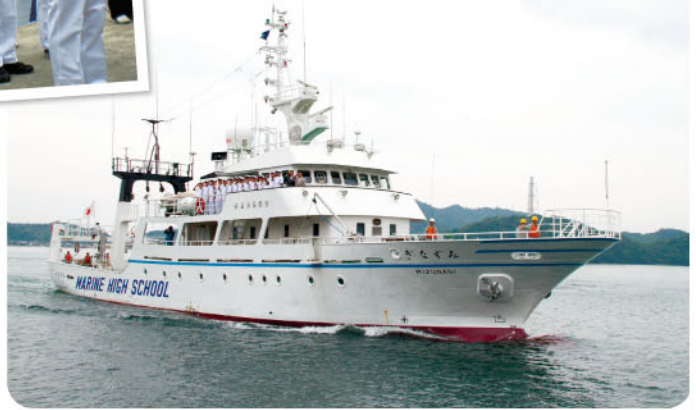
国際航海ナホトカに向け出航