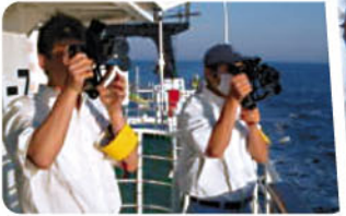
六分儀による天測