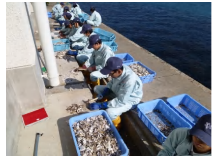
貝殻活用実習(産業廃棄物として処分されるカキ殻を利用できないか、みんなで考えながら作業しました。)