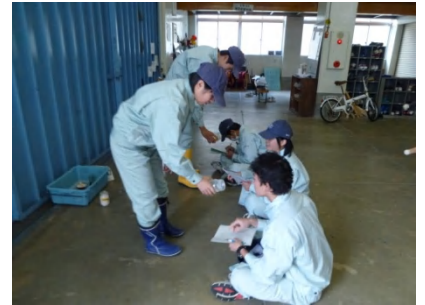
研究活動紹介(3年生が創意工夫しながら取り組んでいる研究活動を学びました。)