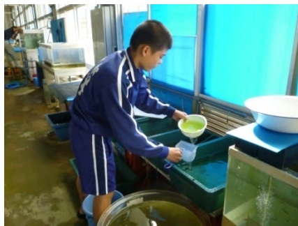
[ ランチュウ管理 ]