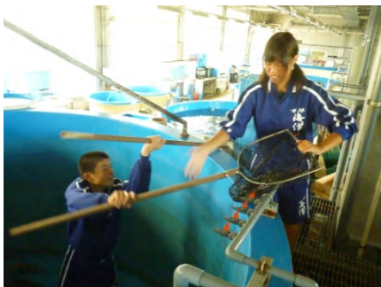
[ マダイ親魚水槽掃除 ]