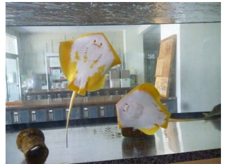
[ 玄関展示水槽へ ]

栽培漁業実習棟で調整していたアカエイのペアは、手から直接エサを食べるほどに慣れ、また配合飼料も食べるようになったので玄関展示水槽へ移しました。人気者になってくれればと思います。