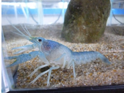
[ 青ザリガニ ]