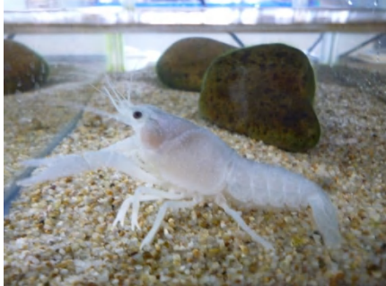
[ 白ザリガニ ]