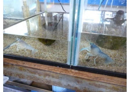
[ 隣り合わせで飼育 ]

9月9日、薄い青色だったザリガニが脱皮して白くなりました。与えているエサは隣で飼育している青いザリガニとまったく同じで親も同じですが、体色に変化ができました。ある程度の個体差はあると思うのですが、ここまで違いが現れたのが不思議です。