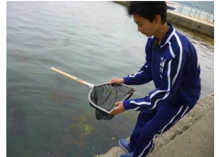
【 採集の様子 】