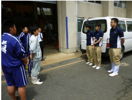
【 紹介・挨拶 】

採集対象魚種はキヌバリです。稚魚期は群れをつくり泳ぐ綺麗な魚で、今年は栈橋で多く見かけます。キヌバリ以外ではアミメハギやヨウジウオ、アナハゼなどを採集することができました。この他、マリンバイオ部で飼育しているサラサエビを提供しました。マリンバイオ部員はこれらの生き物が展示される日を楽しみにしています。