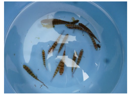
【 キヌバリ他 】