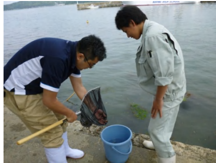
【 採集の様子 】