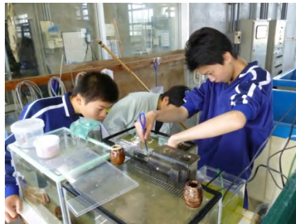
【 飼育生物提供 】