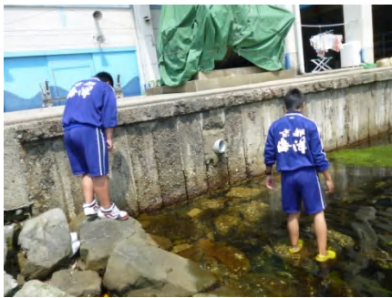
【 採集の様子 】