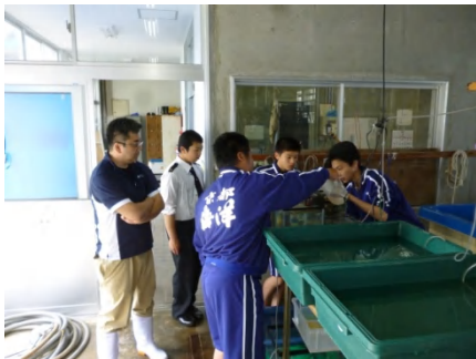
【 栽培棟にて 】