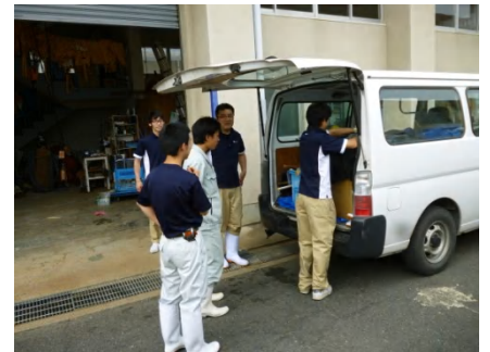
【 積み込み 】