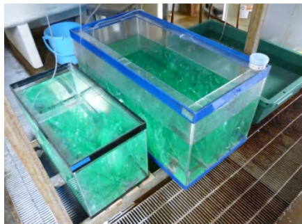
【 産卵巣収容 】