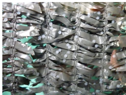
【 受精卵 】