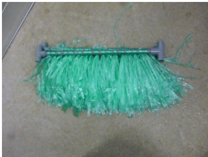
【 産卵巣完成 】