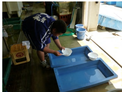
【 5月 大小選別 】