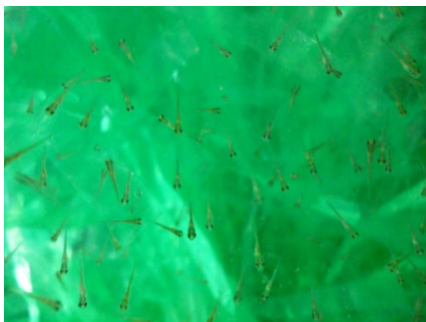
【 稚魚 】