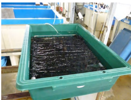
【 産卵巣収容 】