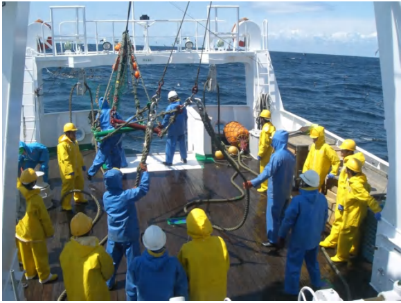
みんなで力を合わせて網を揚げました。

4月19日(火)～21日(木)、3年航海船舶コースの生徒が、実習船「みずなぎ(185トン)」に乗船し、底曳網漁業を行いました。20日(水)は荒天のため、海洋観測実習に切り替え、舞鶴湾など合計29か所の観測を行いました。最終日には本校において「海洋市場」を開催し、漁獲物の一部を販売しました。