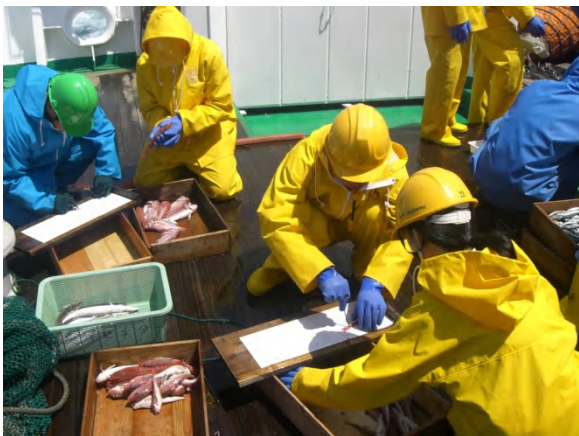
漁獲した魚は魚種別に選別し、重量測定とパンチングを行いました。