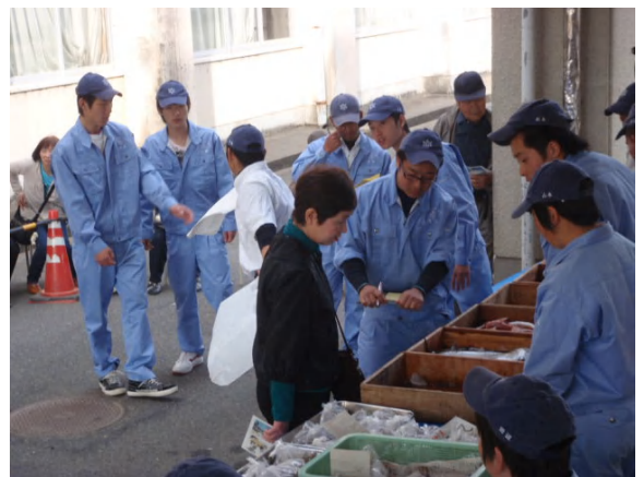
「海洋市場」では、地域の方に漁獲物を購入していただきました。