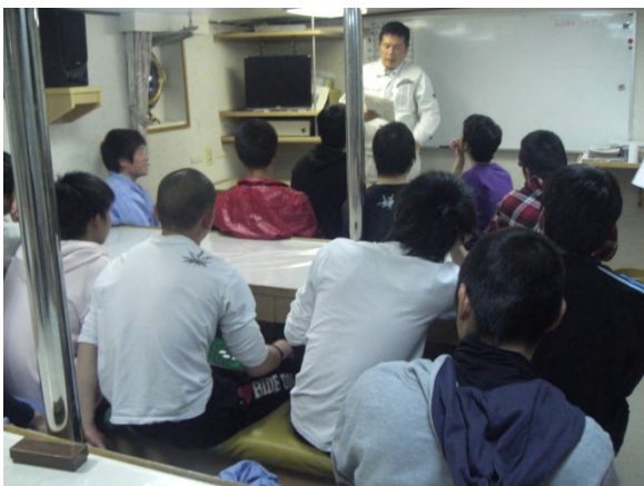
毎晩21時からミーティングを行い、本日の反省とその日の予定を確認しました。