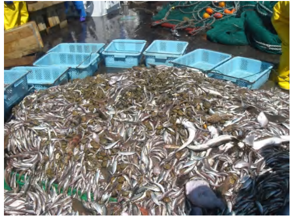
カレイ類やニギス、アカムツなどが漁獲できました。